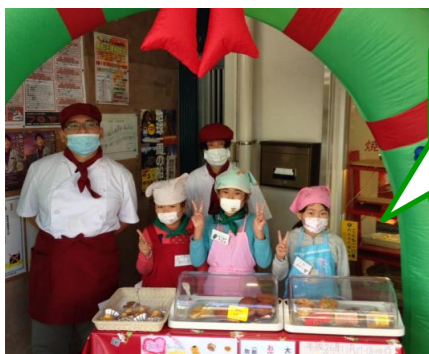
大口台小学校の生徒さん達

10月から11月にかけて、子安小学校と大口台小学校の生徒さんの体験学習に協力させていただきました。一緒にパンを作って販売しました。