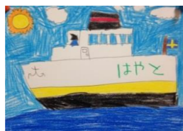
作画：宮原一翔さん