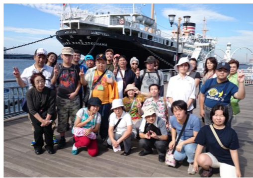
山下公園：氷川丸の前にて