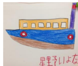
作画：星野維与那さん

10月3日にパン工房ゆうきの利用者さんとパートさん、ボランティアさんとみなとみらい周辺を散策してきました。